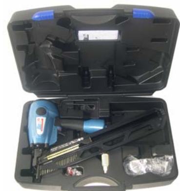
Pointe type R 20

Prix hors taxes, port en sus, indications non contractuelles et sous réserve de modification