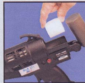
Piston antiadhésif et facilité de chargement