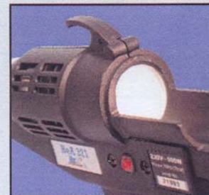
Fût du canon en PTFE et lampe témoin de branchement