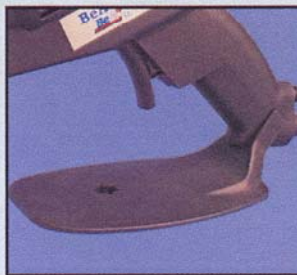
Livré avec un pied intégré